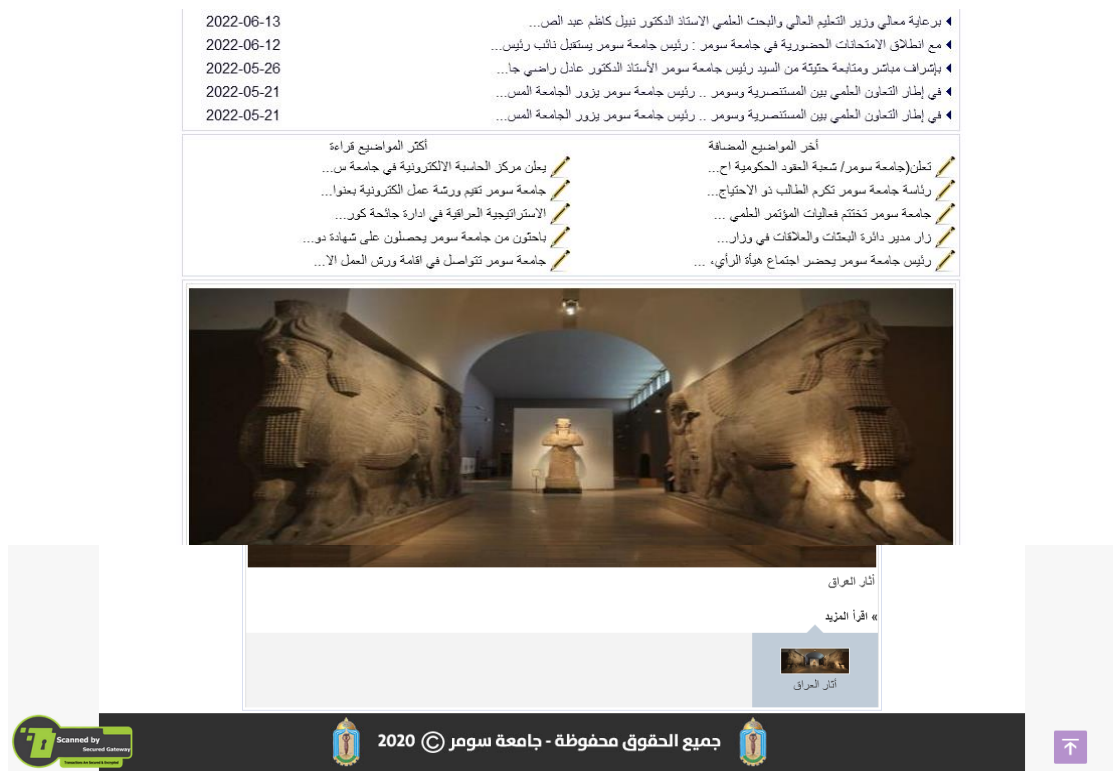
شكل رقم (٤) الصفحة الرئيسية واجهة الموقع باللغة العربية